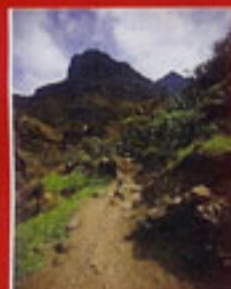
OZ reizen in Tenerife