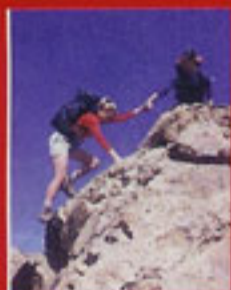
de sociale dienst

nr 109 April - Mei - Juni 2009 Driemaandelijks