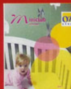
OZ-shop en de miniclub